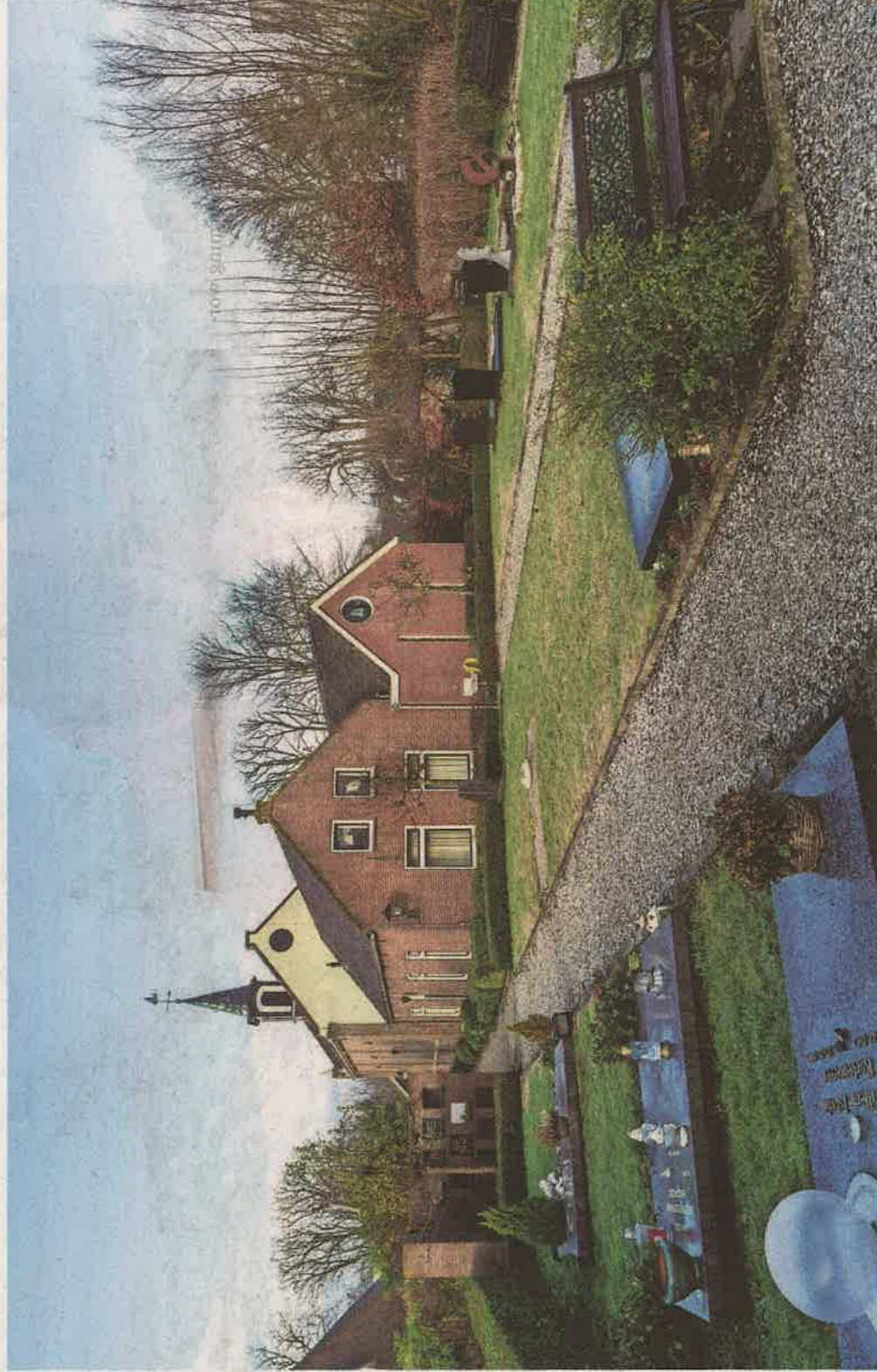
Beeld vanaf de begraafplaats. Links de Kerckwijkzaal, rechts het mortuarium en achter de Kaagse kerk.

Ook het kerken zal er een stuk plezieriger op worden. Zo kunnen de twintig tot vijftig leden die in niet-coronatijden bijeenkomen, een kleine, intieme kring vormen. In de jaren '60, toen de kerk nog wekelijks vol zat, zijn de galcrijzen naast het orgel zo uitgebreid dat 120 mensen een plekje konden vinden. Die uitbrei-